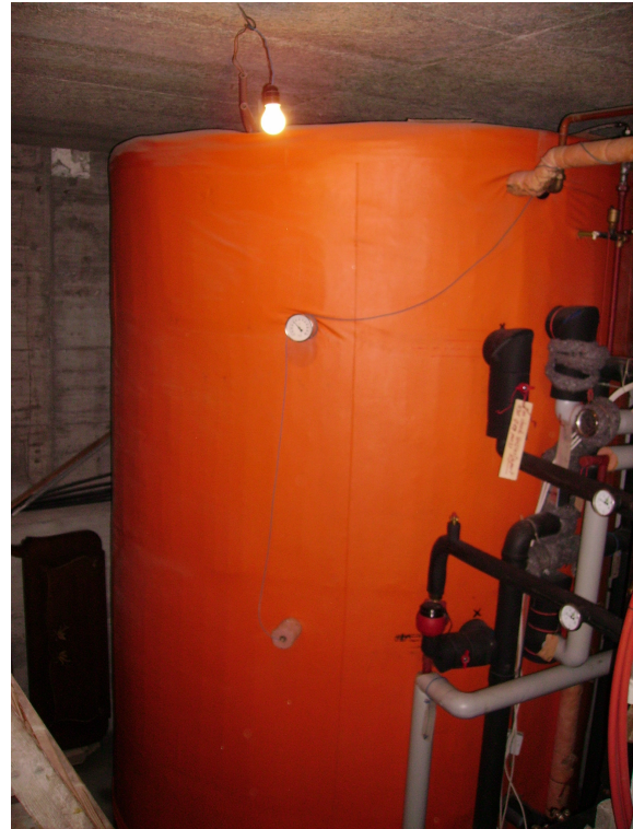
La cuve de 11 000 litres se trouve sous le séjour, sa mise en place relève de l'exploit.