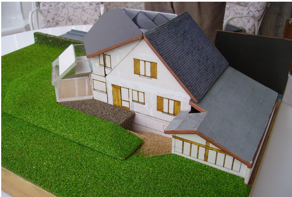
Maquette montrant l'intervention sur la construction originale de 1926.

Ce résultat n'est pas le fruit du hasard mais d'un ensemble de mesures intuitives. L'idée est d'une part de limiter les pertes de l'enveloppe et d'autre part de stocker l'énergie solaire.