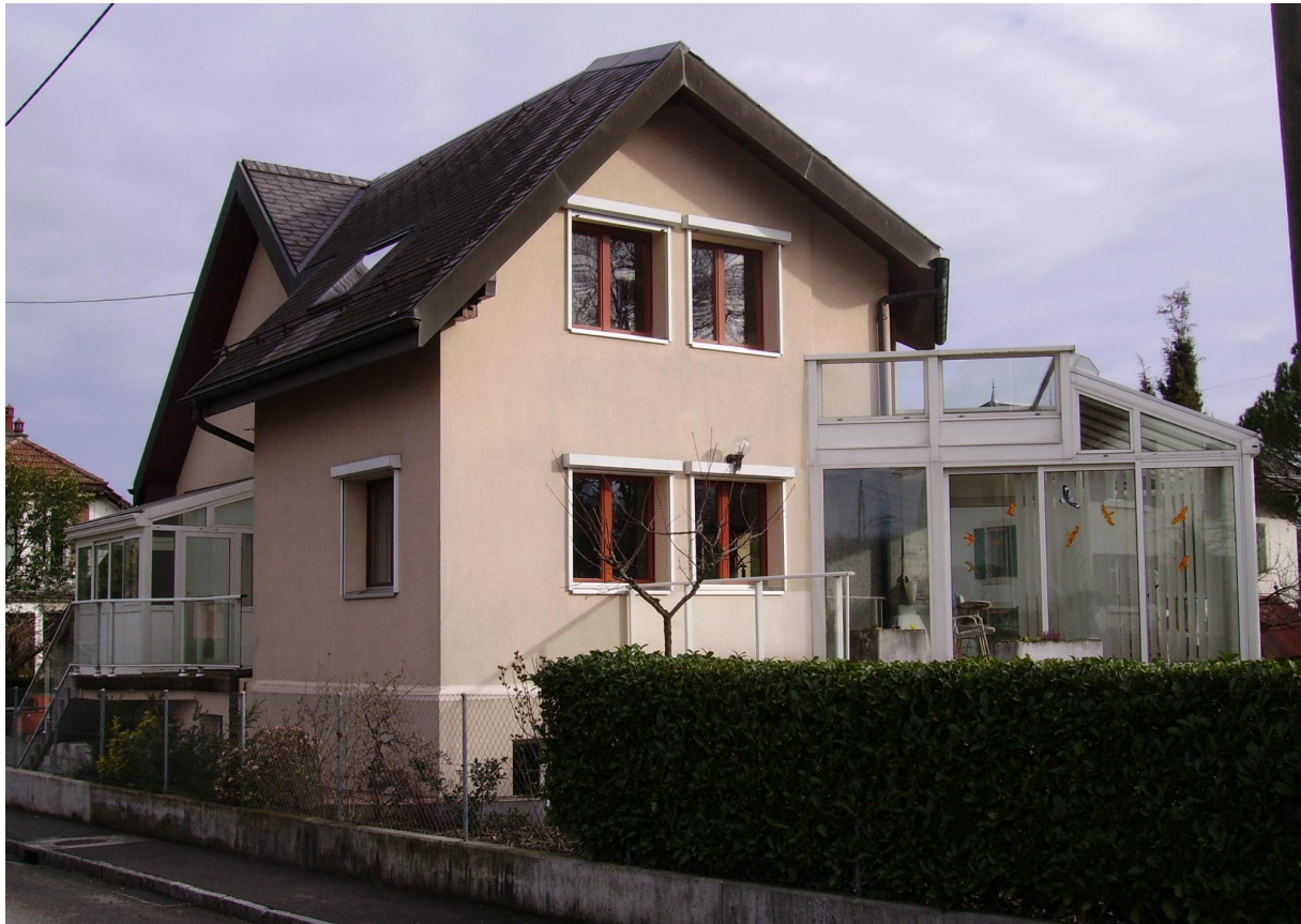
Vu du chemin d'accès, rien ne laisse deviner la particularité de cette villa.

Ce n'est un secret pour personne, le terrain disponible pour la construction de nouvelles villas à Genève est pratiquement inexistant. Parmi les privilégiés qui tentent l'aventure, encore plus rares sont ceux qui franchissent le pas en commanditant une construction écologique. Si pour un grand nombre de citoyens, ce choix s'impose comme une évidence, la réalité des statistiques nous apprend que seule une infime minorité d'habitants est prête à déboursier un peu plus pour investir dans un bâtiment à très faible consommation énergétique. Pourtant, dans notre pays, le tiers de l'énergie achetée ou consommée l'est pour couvrir les besoins en chauffage de l'habitat. Il est donc primordial de limiter au maximum les déperditions inutiles d'énergie de l'ensemble du patrimoine bâti. La construction de nouvelles villas écologiques, voire simplement bien isolées ne suffit pas à compenser le gaspillage actuel. Pour influencer significativement la diminution des pertes, et alléger la facture énergétique, c'est bien évidemment une démarche individuelle de rénovation qu'il faut encourager.